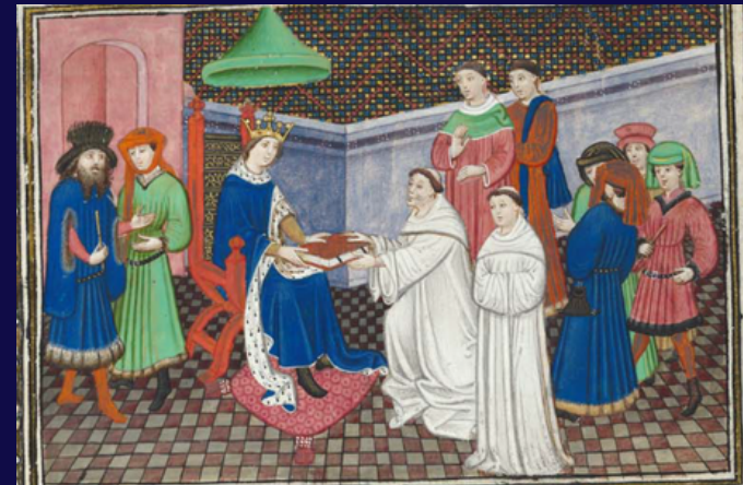
Bruxelles, KBR, ms. 9474, f.1r.

Université de Genève Faculté des Lettres Uni Mail, Salle M1193 Bd du Pont-d'Arve 40 1205 Genève